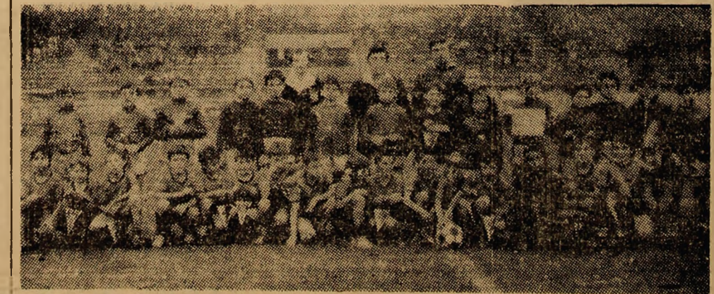
O imabine-album pentru protagoniștii finalei de duminică în „Cupa Jiul”.