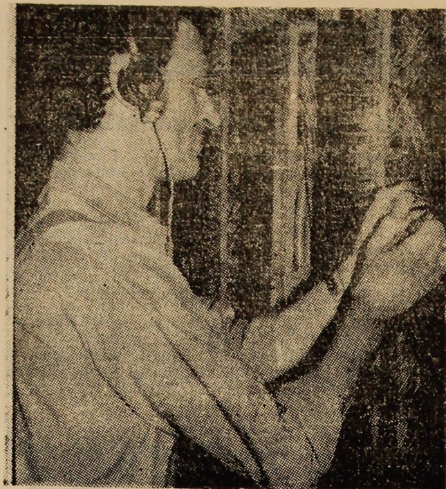
Intervenție în stația de frecvență a telefoanelor.

A deveni proprietarul unui autoturism, în condițiile zilei de astăzi, este totuși un deziderat realizabil, un muncitor priceput și harnic își poate permite economisirea periodică a sumei de bani necesară, numai în municipiul nostru există cîteva mii de posesori de autoturisme. Dobîndirea unor astfel de bunuri cu îndelungată folosință necesită însă și știința conducerii lui, în condițiile stabilite de lege, condiții menite să asigure buna desfășurare a traficului rutier, evitarea pericolului unor accidente, deci protejarea stării de sănătate a participanților la trafic și pietonilor. Iată de ce dobîndirea permisului de conducere nu se face peste noapte, dimpotrivă, se petrece după terminarea unor cursuri într-o unitate școlară specială, trecerea unor teste și examene, verificarea stării de sănătate, acumularea unei necesare experiențe la vo-