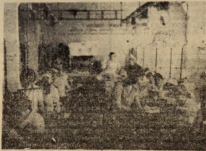
Aspect de muncă din Întreprinderea de Confecții Vulcan.

Pentru constructorii de mașini de la I.U.M.P., „3R” constituie un aspect al muncii cărui se acordă atenția cuvenită.