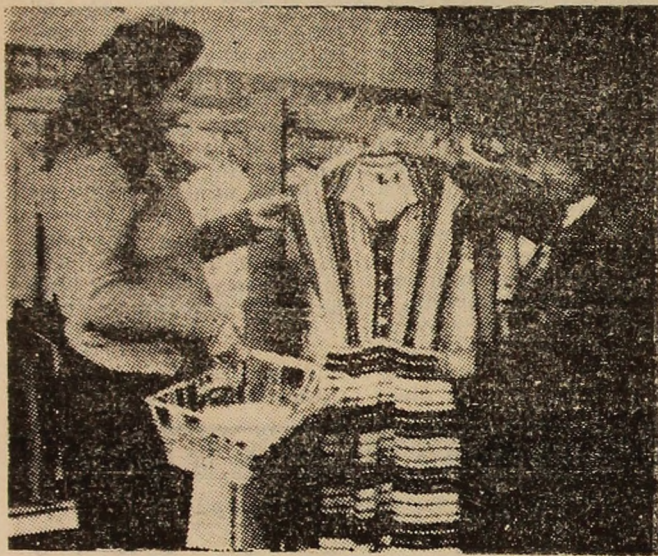
Unitatea de „confecții tricotate” femei din cartierul Bucura-Uricani este recunoscută pentru calitatea servirii și diversitatea mărfurilor.

O altă soluție tehnică, aflată în curs de realizare, cu efecte pozitive în ce privește sprijinul acordat brigăzilor rămase sub plan, este amplasarea, la fiecare intersecție de benzi, a cite unei mese de dozare. Pe lângă faptul că se realizează, în felul acesta, o dozare uniformă a cărbunelui, se evită supraîncălzirea benzii și, în acest timp, se reduc riscurile de rupere. Asemenea lucrări s-au încheiat la benzile 12 B și 12 A și sînt în curs de e-