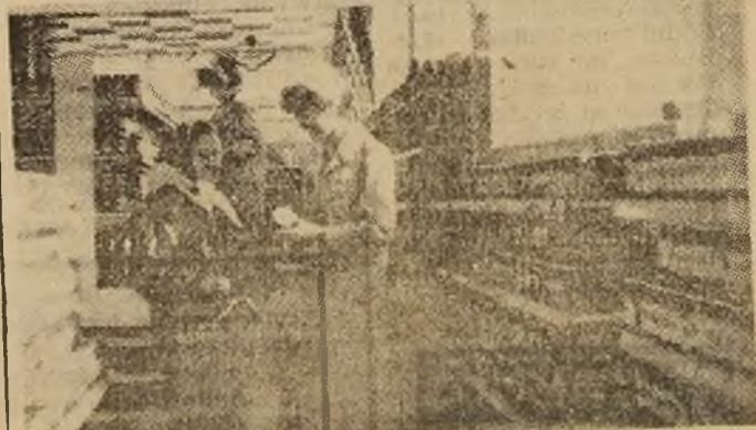
Colectivul unității nr. 17 „Autoservire” din cartierul Petroșani Nord se bucură de aprecieri din partea cumpărătorilor. Secretul? Servirea civilizată, aprovizionarea ritmică, oferirea mărfurilor cu amabilitate.

a produs peste 33 000 000 kWh. Strădaniile și eforturile colectivului de a produce cât mai multă energie electrică trebuie să le sprijinim cu toții prin gospodărirea judicioasă și folosirea rațională a acestui bun de pret — energia electrică —, fără de care nu poate exista progres și bunăstare. Energeticienii, o produc muncind neobosiți, zi și noapte, noi trebuie să o folosim rațional și chibzuit.