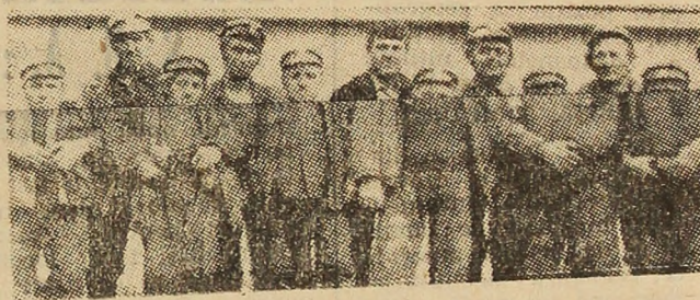
Pentru albumul ortacilor. Bărbați care onorează titlul de miner.