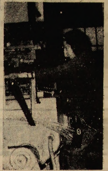
Aspect de muncă din atelierul electromecanic al Preparației din Corocesti.

Așadar, afirmațiile din ancheta de la început de an la I.U.M.P. au acoperit în fapte, spre lauda acestui colectiv harnic și competent.