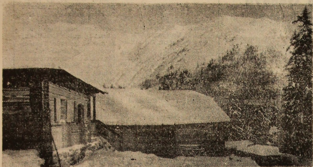
Din amintirile iernii trecute, o invitație în avanpremiera sezonului care se apropie.