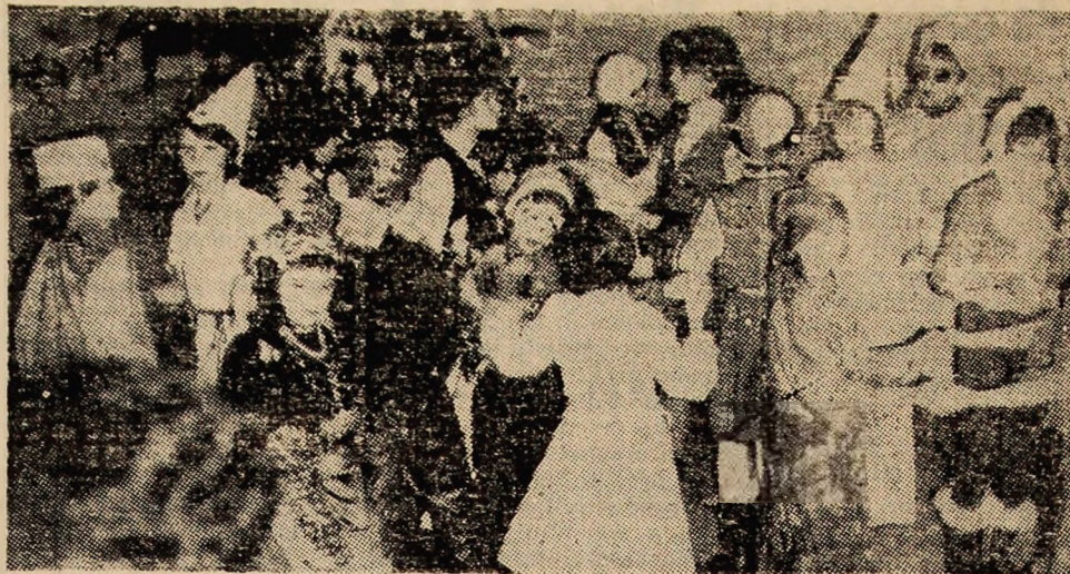
Încă puțin și vacanța de iarnă își va intra în drepturi. Deja copiii se gîndesc la tradiționalul carnaval de Anul nou. Oricum și în acest an, sîntem siguri, Moș Gerilă va fi întîmpinat cum se cuvine.