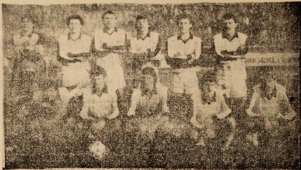
Echipa Jiul, așa cum a fost imortalizată pe pelicula aparatului de fotografiat, la terminarea ultimului meci oficial al acestui an în partida memorabilă cu Corvinul, în „Cupa României”. O echipă, de care ne vom lega speranțele și în primăvara anului '86.