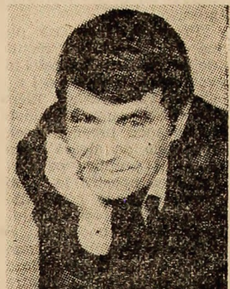
Un îndrăgît cîntăreț al sălilor pline: Dan Spătaru.

element de referință... amuzant, îmi revine în minte afișul primului meu program la... fostul restaurant „Minerul”: „Astă seară cîntă Dan Spătăres-