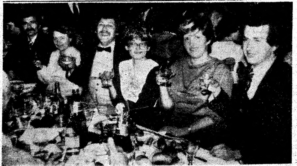
I.M. Vulcan. Voie bună și multă încredere în viitor.

la mina noastră sînt hotărîți să muncească mai mult și mai bine pentru ca, în anul pe care l-am început, I.M. Vulcan să ocupe un loc de frunte în întrecerea socialistă desfășurată în Valea Jiului, pentru a da țării cît mai mult cărbune! (Gh. O.)