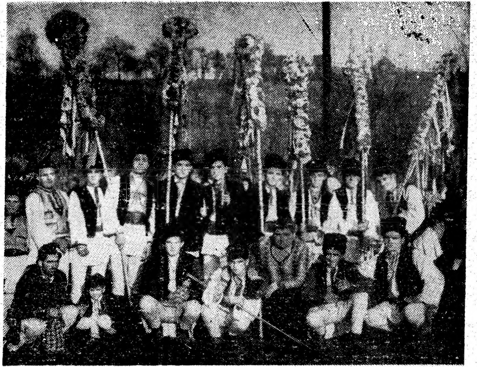
Pitărăii din Maleea la un spectacol în anul 1962.