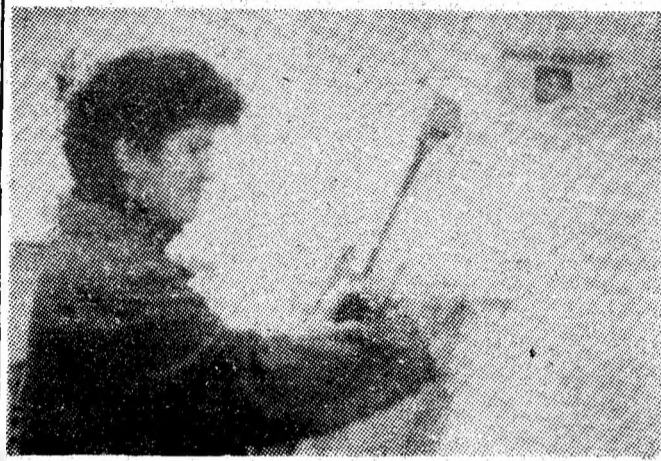
În cadrul ICPMC Petroșani, pe planșele de lucru ale proiectanților iau naștere idei îndrăznețe, puse în slujba modernizării mineritului.

Conștienți de sarcinile majore care ne revin pentru dezvoltarea bazei energetice și de materii prime a țării vom răspunde prin fapte de muncă însușitoare chemării ale tovarășului Nicolae Ceaușescu, secretarul general al partidului, astfel încît sarcinile de plan ale noului an, ale întregului cincinal, în care am pășit să fie realizate la cele mai înalte cote ale eficienței.