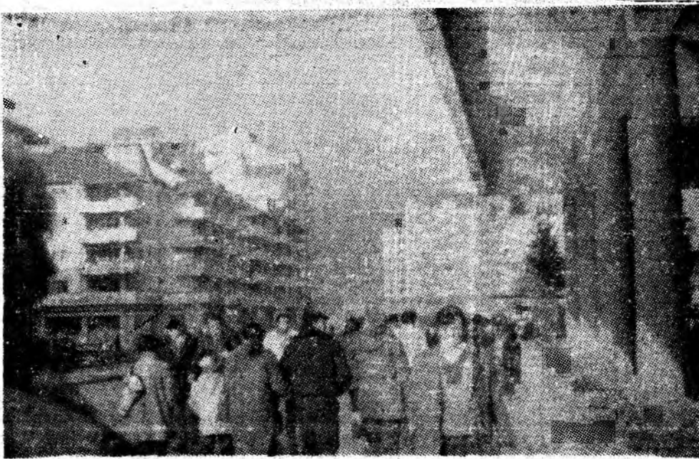
Moderna linie arhitectonică, o caracteristică a cartierului Petrosani Nord.

În spiritul orientărilor și indicațiilor tovarășului NICOLAE CEAUȘESCU