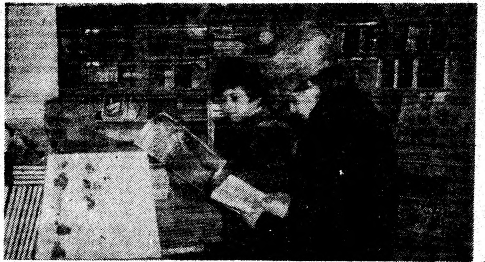
Aspect din librăria „Ion Creangă” Petroșani, unde cititorii pot găsi cărțile preferate.

Cititorii sînt aici într-o adevărată „casă a cărții”.