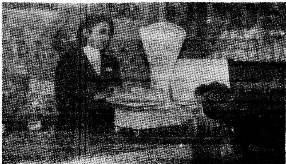
Imagine de la noua cofetărie din cadrul Complexului de alimentație publică din orașul Vulcan.