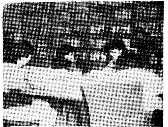
Bogăția titlurilor, diversitatea volumelor existente la biblioteca clubului sindicatelor din Lupeni — un permanent punct de atracție pentru tineri.