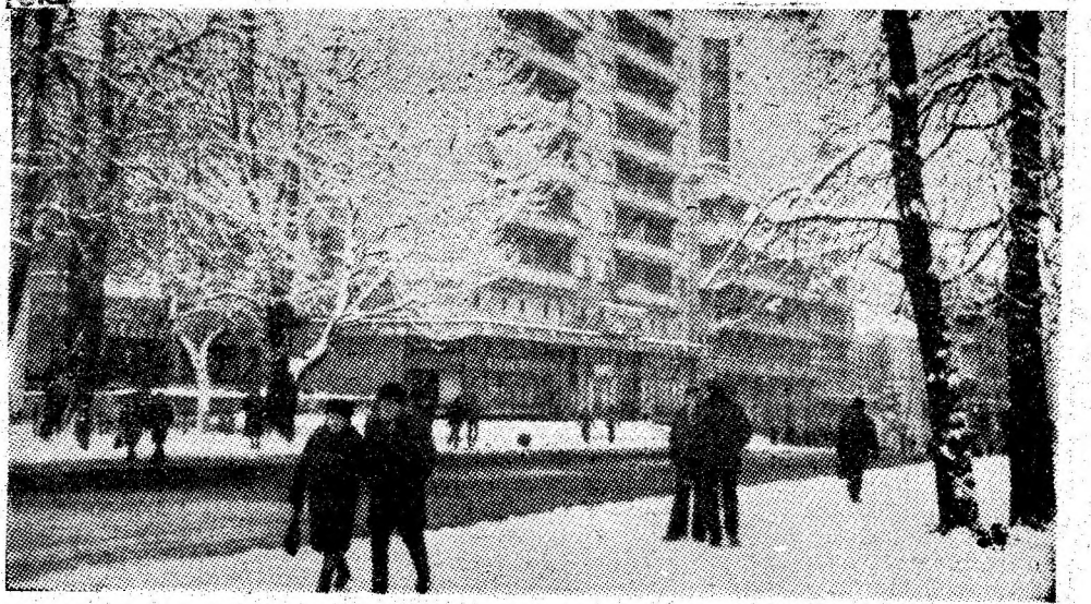
Imagine de iarnă de pe Bulevardul Republicii Petroșani.