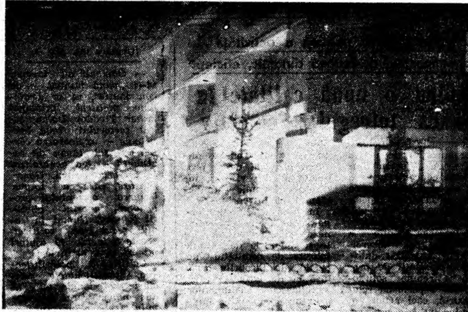
Decor hibernal... nocturn.