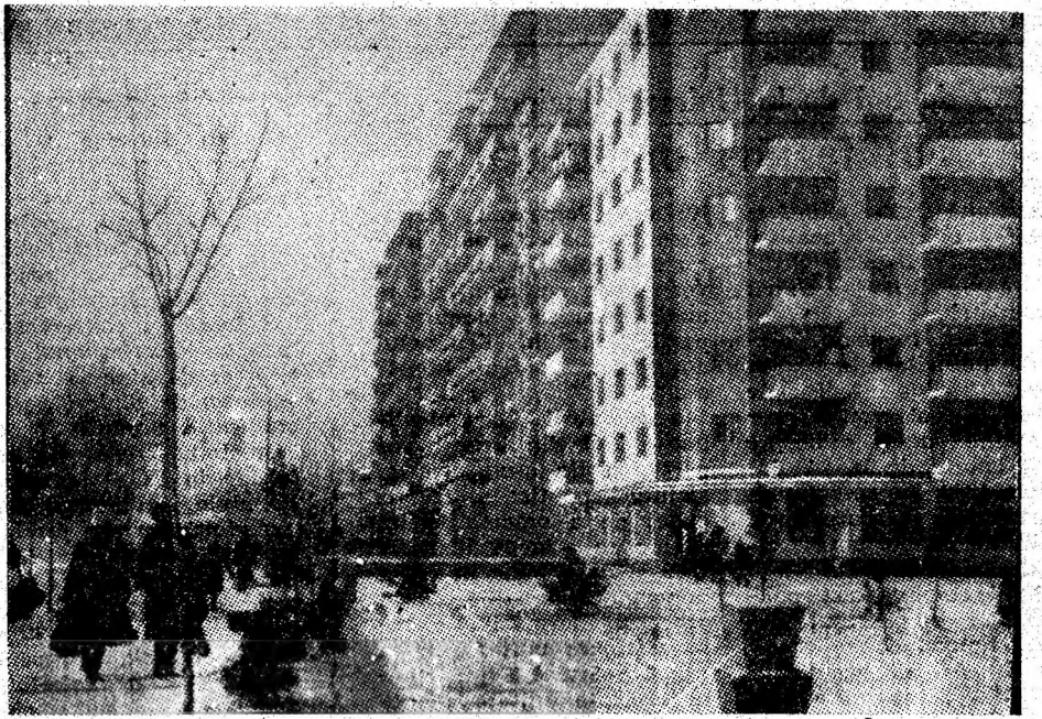
VULCAN. Așezare minerească ce a cunoscut în anii rodnicii ai „Epocii Nicolae Ceaușescu“ o impetuoasă dezvoltare economică și edilitar-urbanistică.

În 21 ianuarie, minerii de la Lupeni și Bărbăteni au extras în plus față de sarcinile de plan 150 tone de cărbune pentru cocs. De subliniat faptul că producția realizată de mina Lupeni a atins cifra de aproape 7000 de tone, colectivul de aici confirmînd, în ultima perioadă, un reviriment în activitatea sa. La fel, minerii de la Bărbăteni au redus, în ultimele zile, în mod substanțial minusul înregistrat în prima parte a lunii, existînd condiții să-și realizeze integral sarcinile de plan pe ianuarie. (S.B.)