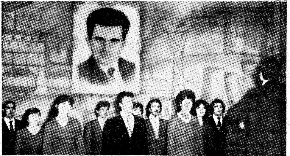
Aspect din emoționantul spectacol omagial din reședința municipiului.

La mulți ani, Eroului întru chipînd o Eră de lumină!