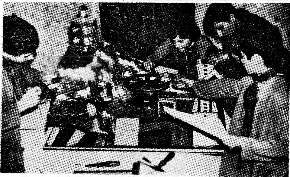
Pionierii în plină activitate creatoare la cercul lor.