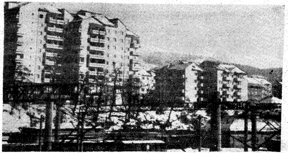
Concurență între verticalele arhitectonice ale Petroșaniului și... înălțimile Paringului.

Aspect din moderna hală de producție a secției „Hidraulică” — I.U.M. Petroșani.