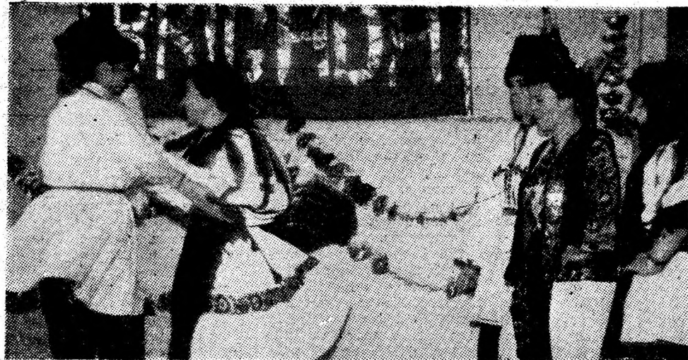
In vîrtejul dansului, membri ai formației artistice de amatori din cadrul I.C.R.A. Petroșani.