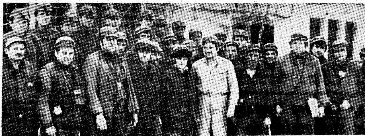
Un colectiv fruntaș în întrecerea socialistă, sectorul de investiții al minei Paroșeni.

Răspunzînd prin fapte Indemnurilor secretarului general al partidului, tovarășul Nicolae Ceaușescu, pentru realizarea programului suplimentar de producție pe 1986, minierii de la Lonea, Dilja, Vulcan, Paroșeni și Bărbăteni au extras în plus față de prevederile de plan ale primelor șase zile din luna februarie 2500 tone de cărbune. Aceste realizări au fost obținute, în principal, prin creșterea productivității muncii, ca urmare a mai bunei organizări a fluxului de producție, întăririi ordinii și disciplinei. (S.B.)