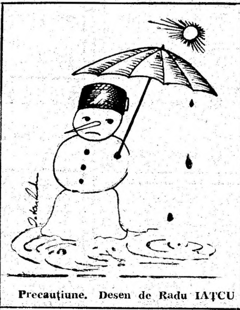
Precauțiune. Desen de Radu IATCU