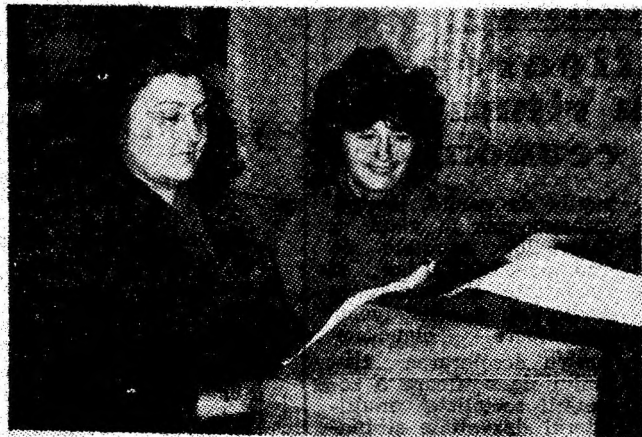
Telegraful Oficiului P.T.T.R. Petroșani, în plină activitate.

nouri ilustrînd realizările din domeniul progresului tehnic ale întreprinderilor din municipiu, în anul 1985, cu deosebire a celor din domeniul mineritului. Participă unitățile miniere din Valea Jiului, întreprinderile de preparare a cărbunelui, construcții de mașini, construcții industriale, unitățile de cercetare — C.C.S.M. și I.C.P.M.C., Institutul de mine, unitățile școlare. (A.I.H.)