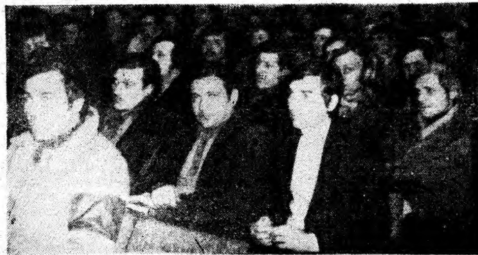
Adunarea oamenilor muncii de la I.M. Lupeni.