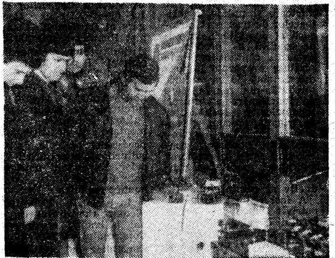
Expoziția realizărilor de creație tehnico-științifică.

Pagină realizată de Ioan DUBEK