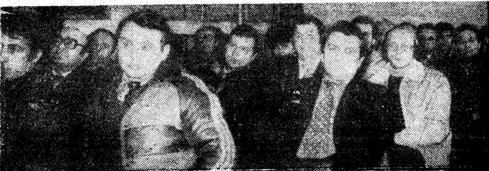
Aspect din consfătuirea consacrată creației tehnico-științifice de masă.

Aspectele dezbătute în cadrul consfătuirii, în pagina a 3-a.