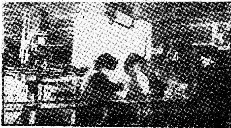
Amabilitate și servire promptă, civilizată — baza dialogului între cumpărători și vinzători la raionul „foto” al magazinului univesal „Jiul”.