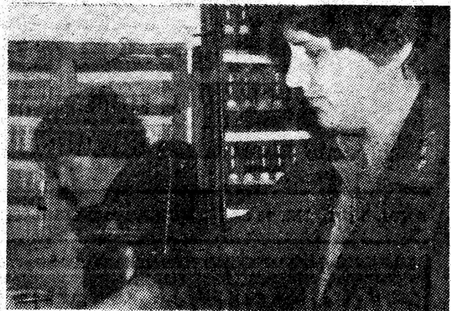
Operativitate, promptitudine, solicitudine, iată ce ne oferă personalul de serviciu al Agenției de vîj C.F.R. din municipiul nostru.