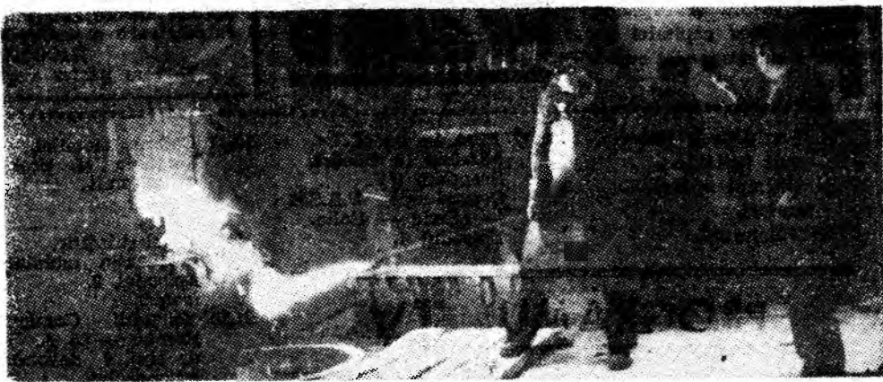
Incandescența fontei în drumul ei spre utilaj.

■ Se vor economisi 150 tone metal și 50 tone combustibil convențional.