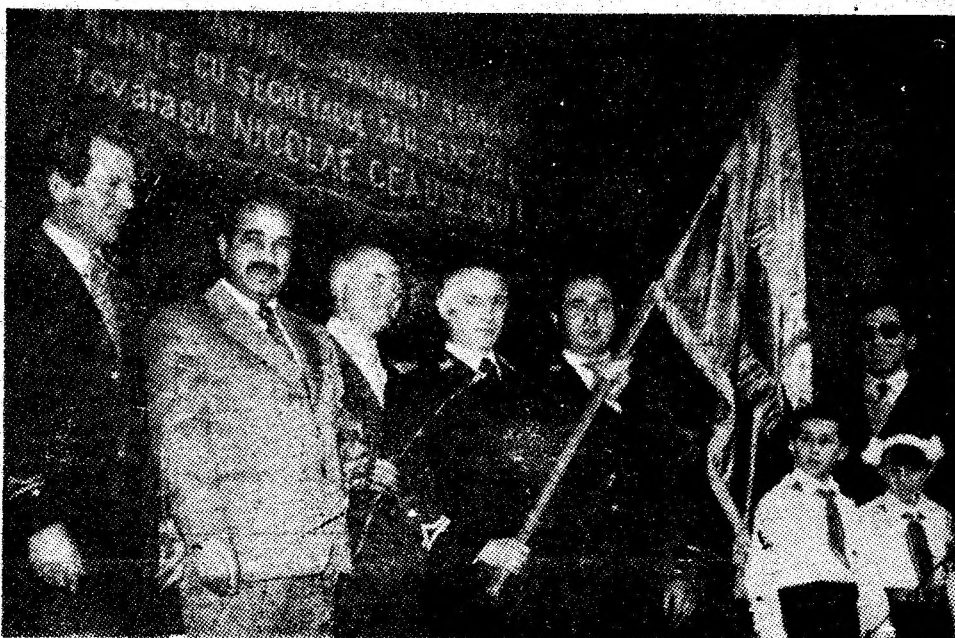
Moment solemn: înminarea Drapelului de întreprindere fruntașă, minei Paroșeni.