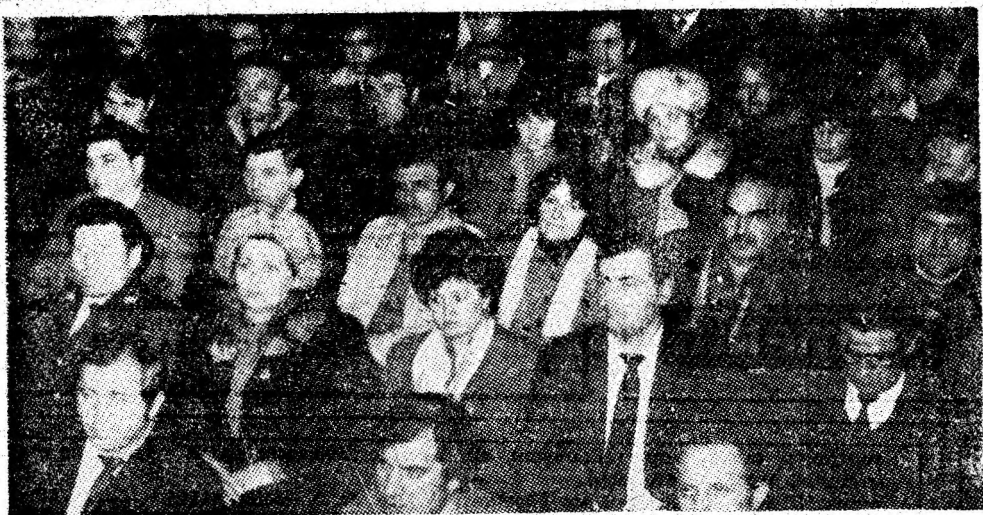
Aspect din cadrul consfătuirii.

Diplome de onoare și trofeul de „Fruntaș în întrecerea socialistă” au mai fost acordate unui mare număr de muncitori din construcții, transporturi, unități ale industriei ușoare și prestărilor de servicii.