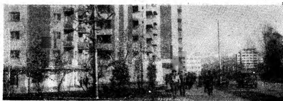
Linii arhitectonice la Lupeni.