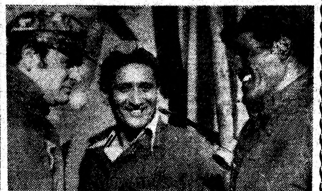
La ieșirea din șut.