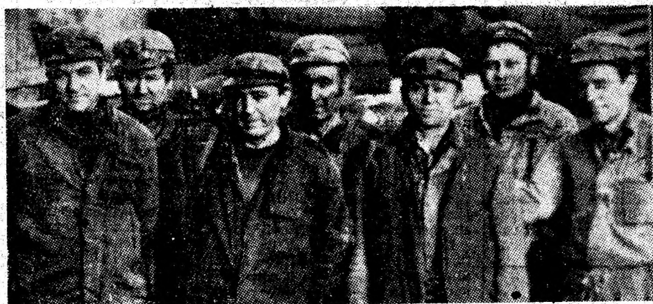
Fruntașii unui colectiv fruntaș. Imaginea noastră prezintă mai mulți șefi de brigadă și maiștri din cadrul sectorului IV al I.M. Lonea.