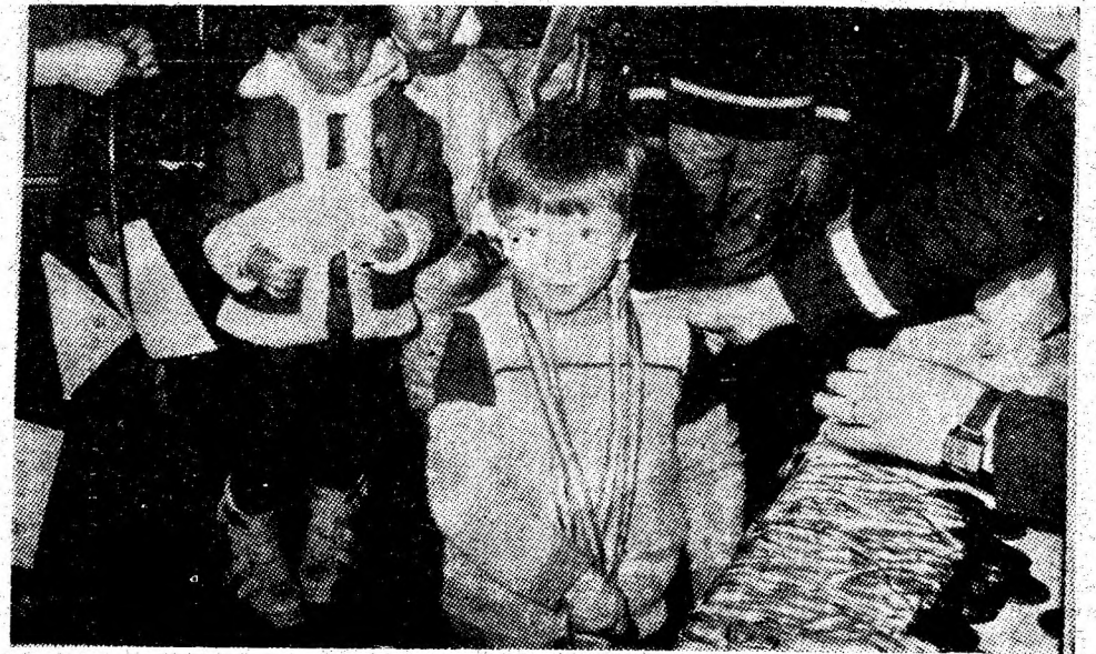
La festivitatea de premiere...