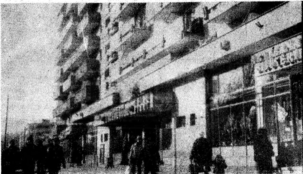
Tineretă pe bulevardul Vulcanului.