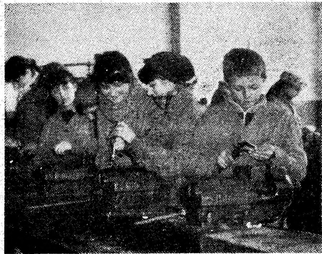
La Liceul industrial din Vulcan, aspect din atelierul-școală.

— La mulți ani, le răs-pund cu emoția redescoperirii permanente a trainiceii legături de suflet a vrednicilor bărbaiți ai subteranului. La mulți ani, Feți-Frumoși, voi care reîntoarceți lumea mitului în realitatea noastră cotidiană, neprețuită investiție a meleagurilor românești, în care români, maghiari și oameni de alte naționalități se bucură, deopotrivă, de soartă fericită.