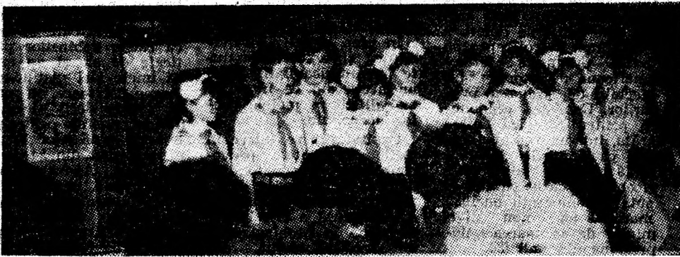
Pionierii Școlii generale nr. 4 Vulcan au prezentat un emoționant spectacol omagial pentru femeile din Întreprinderea minieră Poroșeni.