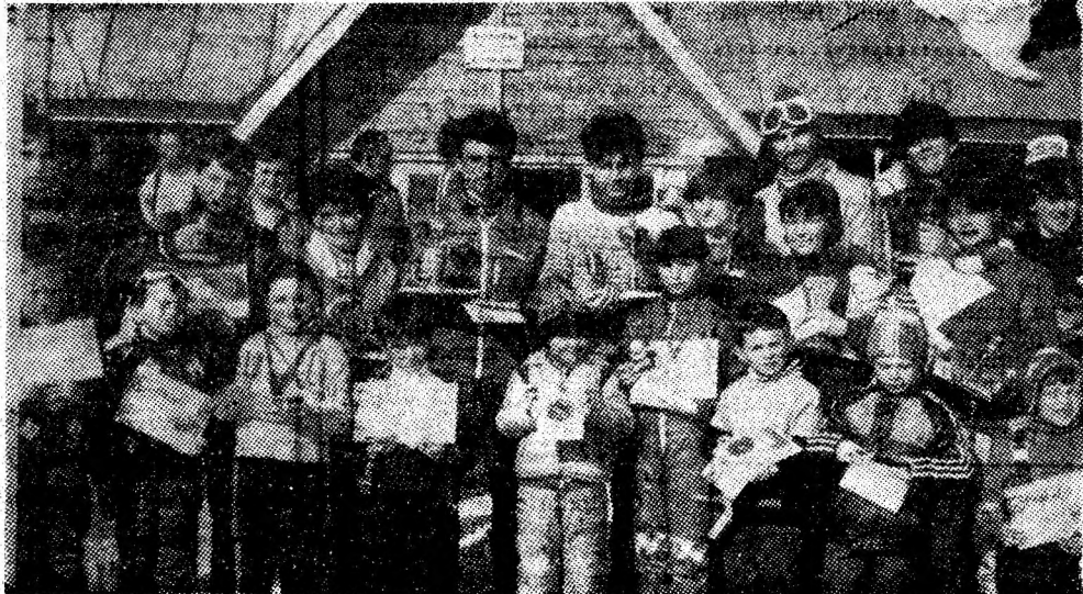
Cîștigătorii trofeelor.