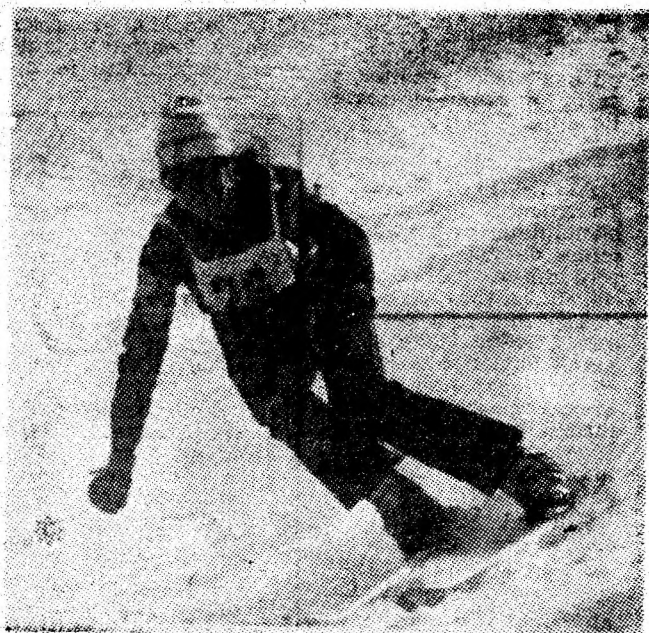
Evoluție spectaculoasă la slalom.