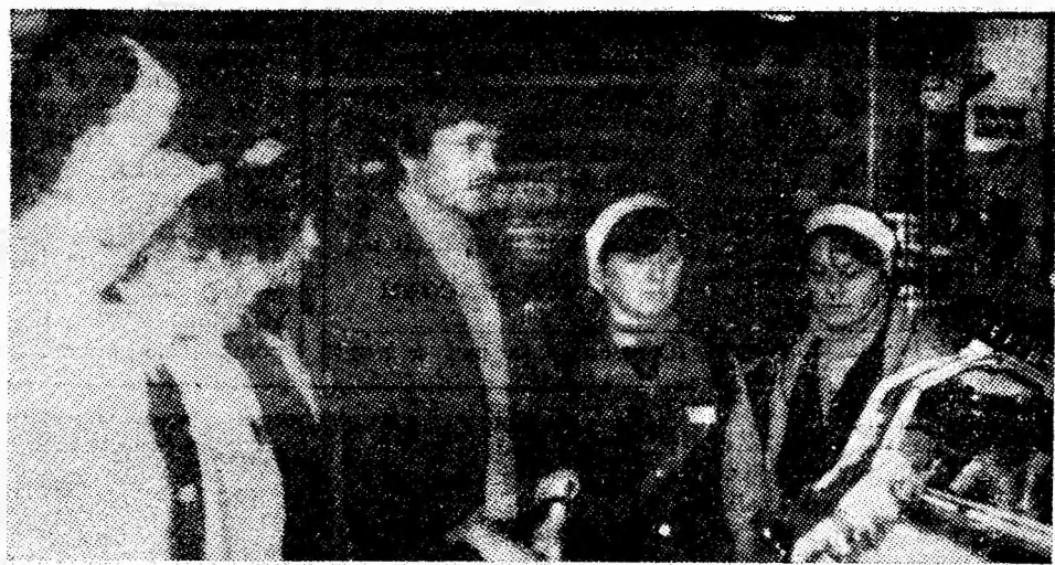
În atelierile de producție ale Întreprinderii de tricotație din Petroșani, absolvenții treptei I de liceu iau cunoștință despre specificul activității și condițiile create pentru încadrarea și calificarea tinerilor.

Pe lângă lucrările amintite, minierii acestui sector mai au de executat în acest an și alte lucrări de montare a unor conducte de aer și apă, ca și montări de benzi și complexe mecanizate care să asigure creșterea cantității de cărbune extras în condiții de siguranță sporită. Modul cum au demarat, faptul că în primele două luni și jumătate minierii acestui sector au executat peste sarcinile de plan aproape 70 ml demonstrează că sînt hotărîți ca și în 1986 să-și realizeze și să depășească sarcinile de plan, astfel încît să pregătească minierilor din abataje noi capacități de producție care să asigure realizarea sarcinilor de plan în viitor.