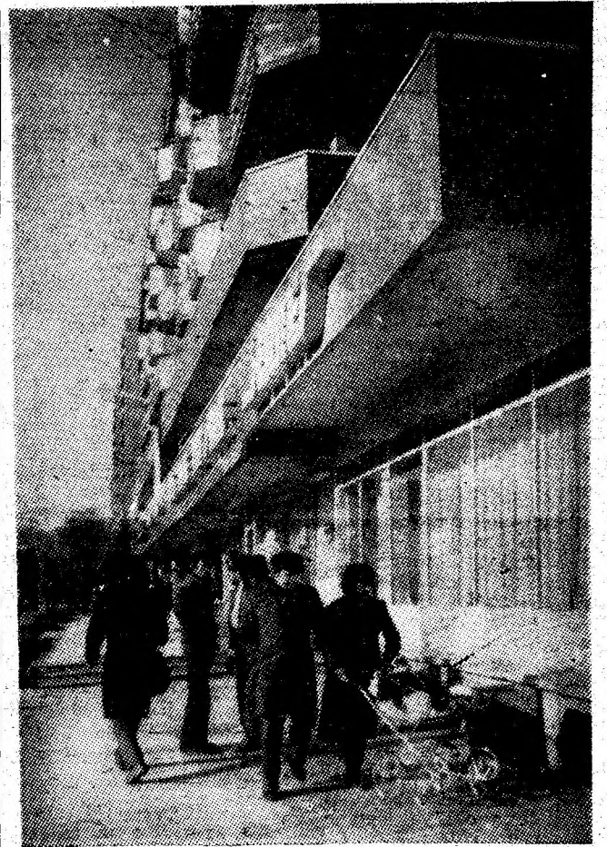
Animație pe bulevardul Petroșaniului.