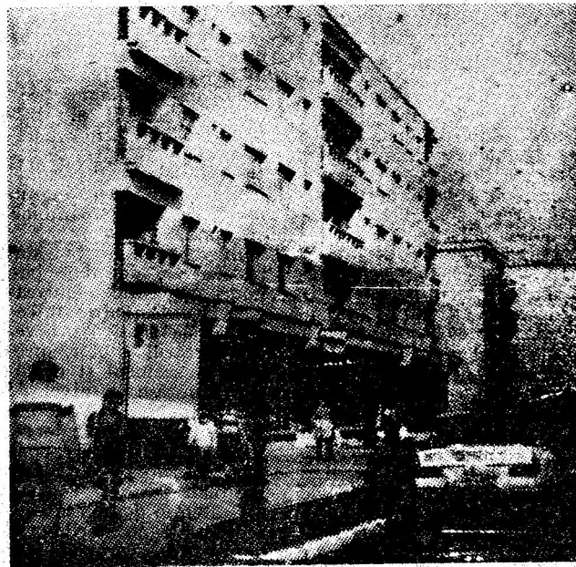
Ample lucrări de gospodărie și înfrumusețare schimbă zilnic aspectul cartierului Bucura din orașul Uricani.