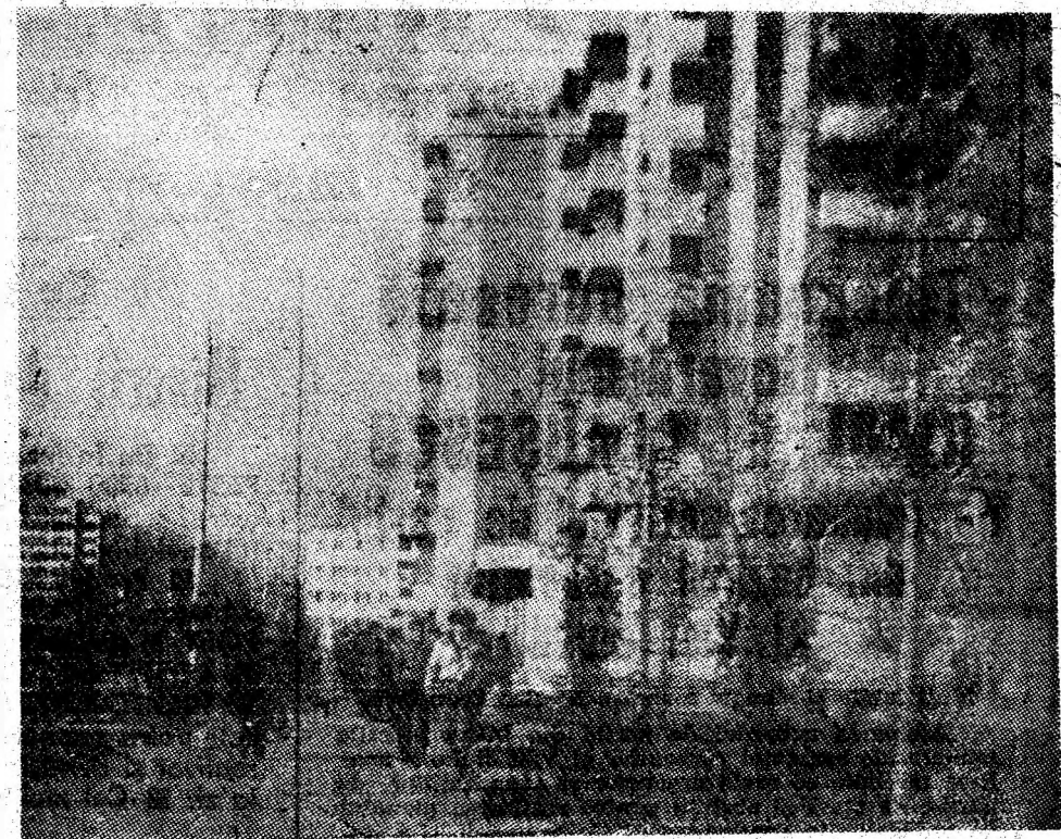
Accente moderne în arhitectura orașului Vulcan. În imagine, Bulevardul Victoriei.

Vă asigurăm că minerii Văii Jiului, urmînd cu devotament patriotic politica Partidului Comunist Român, strîns uniți în jurul partidului, al dumneavoastră, iubite tovarășe Nicolae Ceaușescu, vor face dovada abnegației și dăruirii lor în muncă și vor acționa cu elan și energie pentru asigurarea economiei naționale cu cantități sporite de cărbune, pentru creșterea contribuției acestui important bazin carbonifer la prosperitatea și progresul continuu al României socialiste.