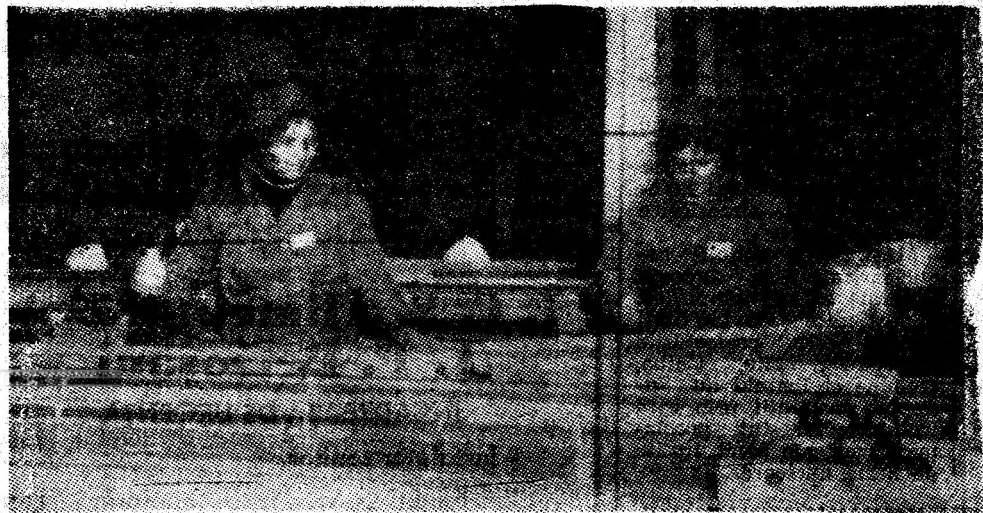
Aspect de muncă din cadrul Țesătoriei de mătase din Lupeni.