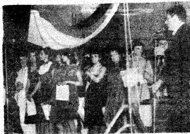
Aspect de la festivitatea de premiere.