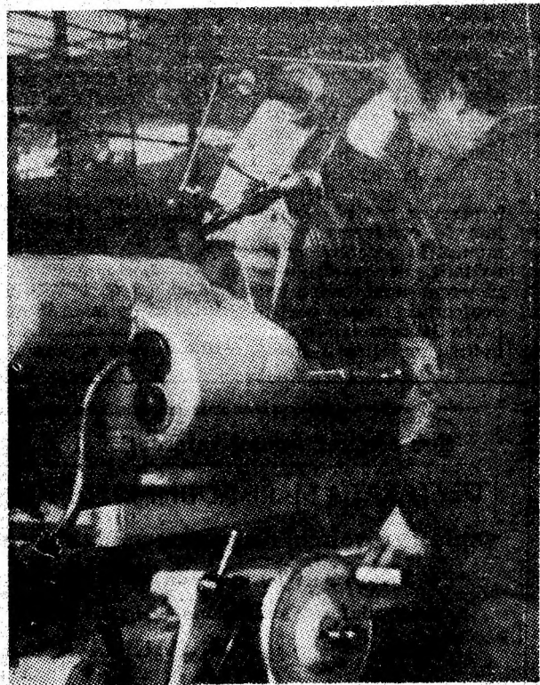
I.P.S.R.U.E.E.M. Petroșani. Aspect de muncă din atelierul de prototipuri.

Acțiunea, întreprinsă din inițiativa C.O.M., a fost consacrată curățirii terenului agricol din preajma solarilor și serelor în vederea începerii lucrărilor de arătură și însămînțări cu furaje pentru efectivele de animale din gospodăriile întreprinderii. (I.D.)