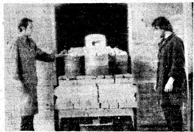
La secția de preparare a cuarțului Uricani se introduce un nou lot de minereuri la calcinare.

În cadrul cabinetului sînt programate săptămînal acțiuni în sprijinul propagandistilor, al muncii politico-educative de masă. (Dan STEJARU)