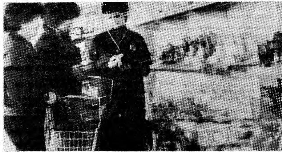
Unitatea nr. 129 „Lucoris” din complexul comercial „Hermes” Petroșani — un etalon al comerțului modern.