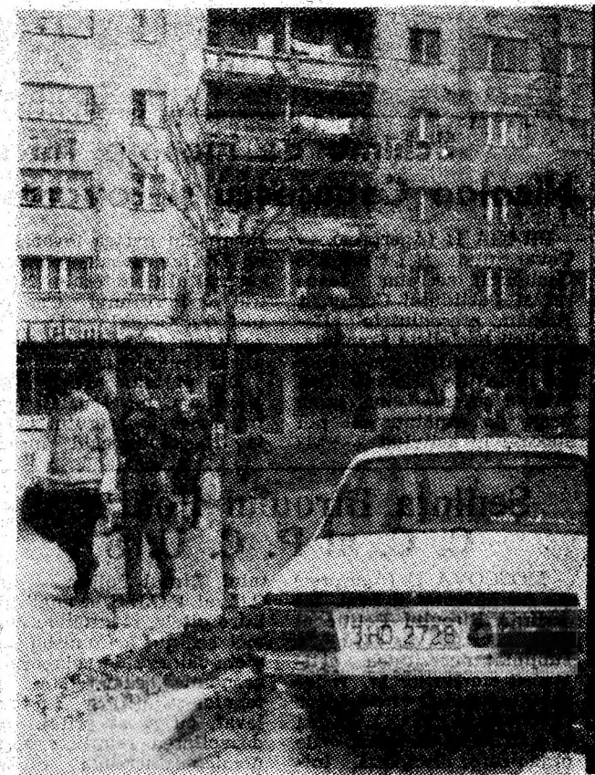
Primăvara pe bulevardul orașului Vulcan.