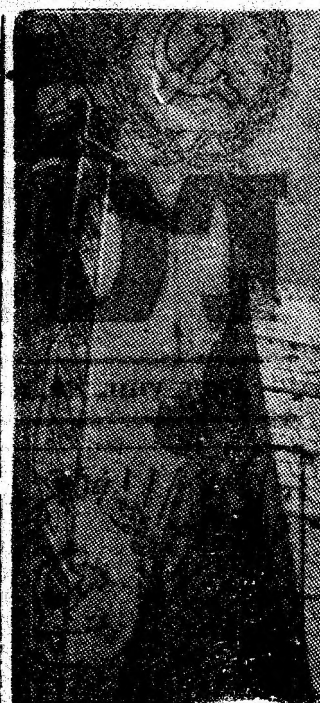
Verticale moderne în peisajul arhitectonic al Văii Jiului.

În acest an, marcat de a 65-a aniversare a partidului, minerii de la Dilja sînt hotărîți să facă totul pentru a se situa printre detașamentele fruntașe ale minerilor din Valea Jiului, răspunzînd astfel vibrațiilor chemării adresate de secretarul general al partidului, tovarășul Nicolae Ceaușescu, de a da patriei cît mai mult cărbune. Aceasta este de fapt felul întregii munci politice de la mina Dilja, obiectivul pentru a căru realizare exemplară, acționează cu dăruire și răspundere comunistii.