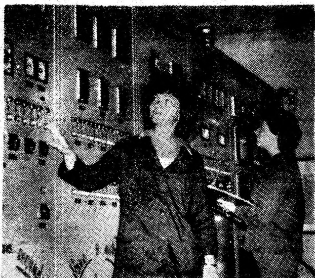
Panoul de distribuție, a instalației de termoficare a Văii Jiului de la UE Paroșeni.