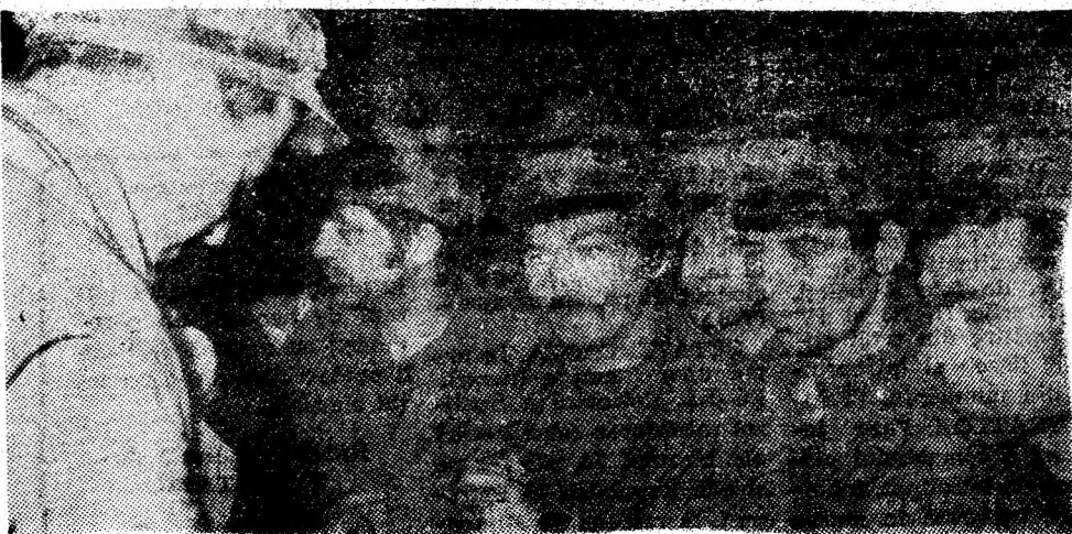
Efectuarea pontajului la sectorul III al I.M. Aninoasa.