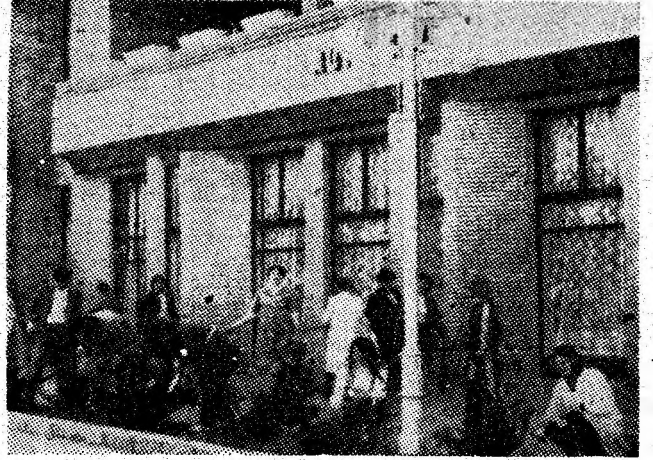
Acțiunea de gospodărire și înfrumusețare — Lupeni.