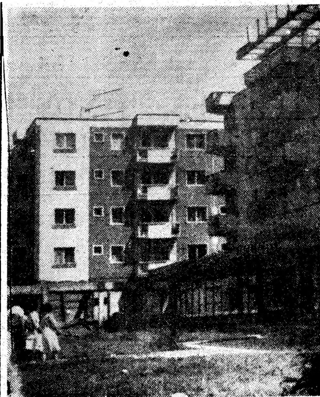
Petrița, anotimpul marilor înnoiri urbanistice.