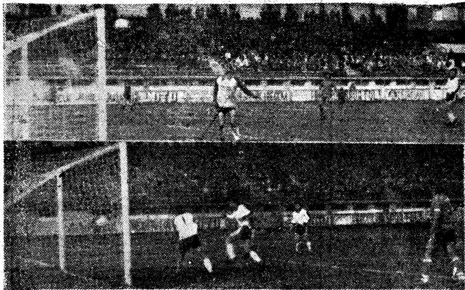
„Filmul” celor două goluri din prima repriză a partidei Jiul — Mecanica Orăștie.