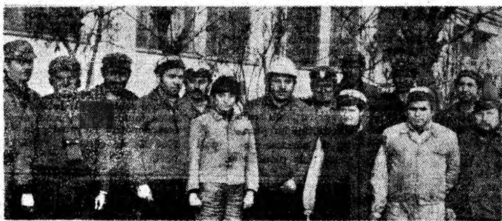
Sectorul I — producție, I.M. Paroșeni. Un colectiv destoinic, angajat cu întregul efectiv pentru creșterea producției de cărbune, situat, prin rezultatele obținute, pe panoul fruntașilor din Valea Jiului.