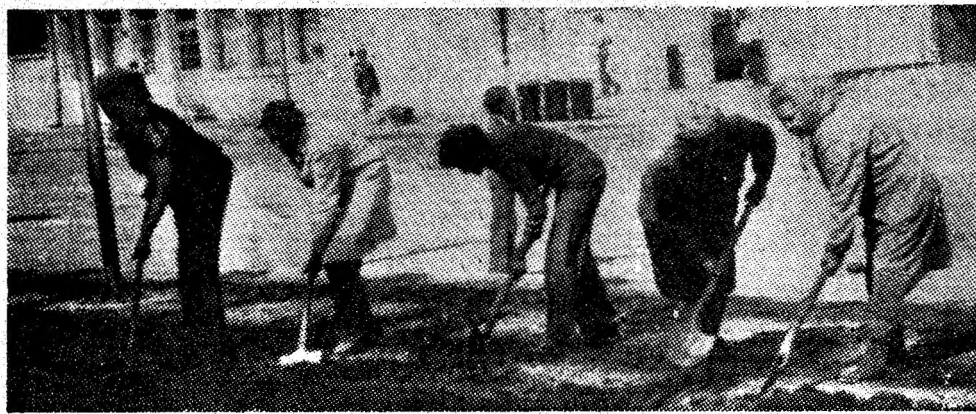
Gospodarii în acțiune. În imagine, lucrătorii de la sera de flori a E.G.C.L. Petrila amenajează spațiile destinate viitoarelor covoare florale.

Iată, deci, un exemplu despre modul cum, coroborate, eforturile unui grup de oameni sînt îndreptate spre același țel: economisirea de energie și, pe această bază, creșterea eficienței muncii minerilor din subteran.