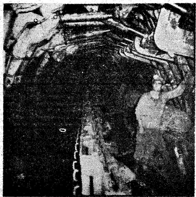
Abatajele frontale mecanizate din zilele noastre — adevărate uzine subterane.

Nu a fost un drum ușor. Nu a venit totul de la sine. Au fost ani de luptă și muncă încordată, ani de căutări, de adaptări și asi-