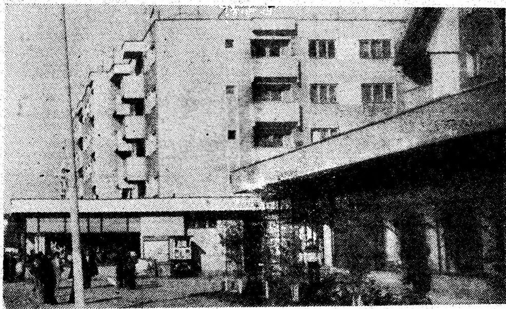
Noul peisaj din orașul Lupeni — cartierul Bărbăteni.