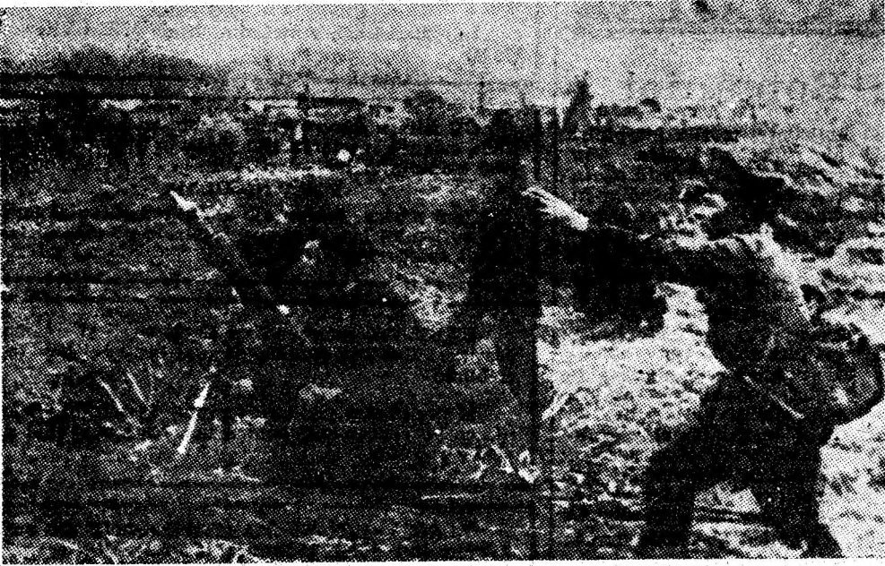
Ostașii români pe frontul antihitlerist.