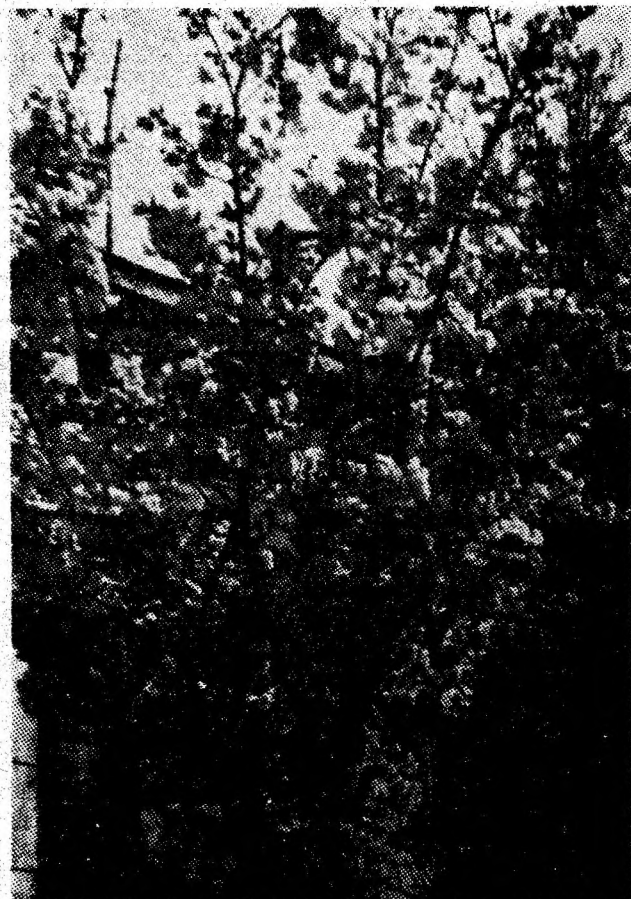
De sezon.